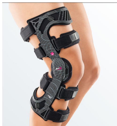
K dispozici v barevných provedeních černá, bílá a limetková/havajská modř